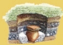
Incinerazione con deposizione in olla.