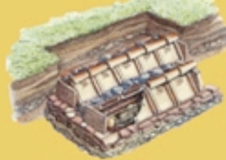
Cassa in laterizi con copertura alla cappuccina.