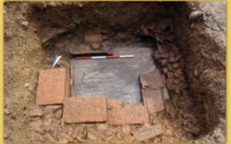
La tomba principale e, sotto, un'ipotesi di ricostruzione della struttura in laterizi e fondo in pietra.

Le altre due tombe si sono conservate intatte perché forse meno visibili. In un caso il corredo, deposto in una cassetta di laterizi, era costituito da due balsamari, un poculum, un'urna con ciotola-coperchio e un'olla. Nell'altro caso la sepoltura consisteva in un'anfora vinaria segata e infissa nel terreno, coperta da una coppa-coperchio che conteneva le ossa e vari elementi del corredo; accanto vi era una seconda olla, coperta da un frammento di embrice.