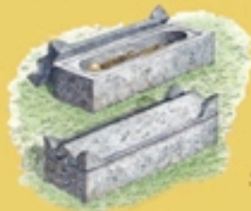
Sarcofago in pietra.