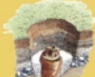
Incinerazione con deposizione in anfora.