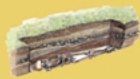
Inumazione in nuda terra.