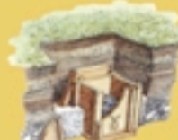
Incinerazione con deposizione in cassetta di tegoloni.