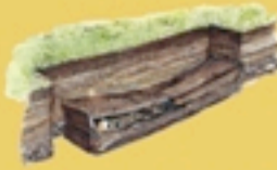
Inumazione in cassa lignea.